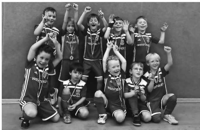
Bambinis der SF Schwendi / VfB Gutenzell

Bambinis und F-Jugend der SF Schwendi / VfB Gutenzell Am Sonntag zeigten unsere mehrere Mannschaften der Bambinis und der F-Junioren ihr Können im heimischer Halle beim SC Schönebürg.