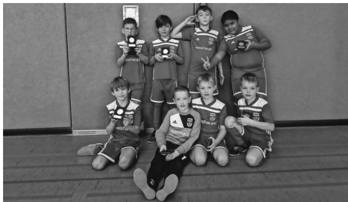
F-Junioren der SF Schwendi / VfB Gutenzell