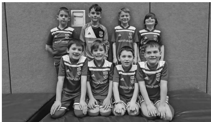
F-Junioren der SF Schwendi / VfB Gutenzell