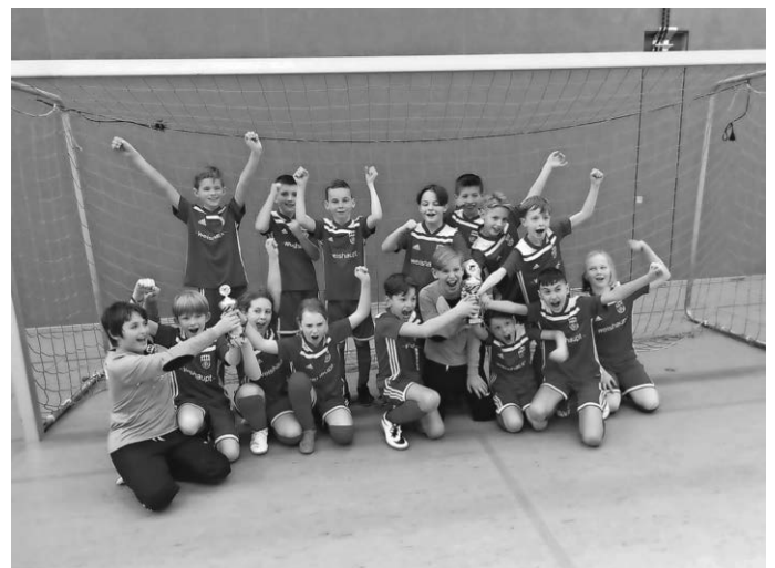
E2 und E3 der SGM Schwendi

Am Sonntag spielte unsere E1 beim SV Sulmetingen und konnte nach vielen zweiten Plätzen dieses Mal bei starken Gegnern den ersehnten Turniersieg mit nach Hause nehmen. Im einem spannenden Finale besiegte man den FV Biberach im Neun-Meter-Schießen mit 3:2.