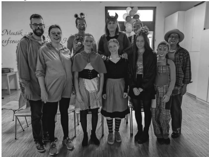
Team "Kinderball 2024"