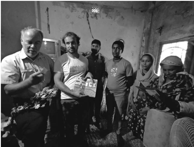
Besuch in der Wohnung einer unterstützten Schülerin