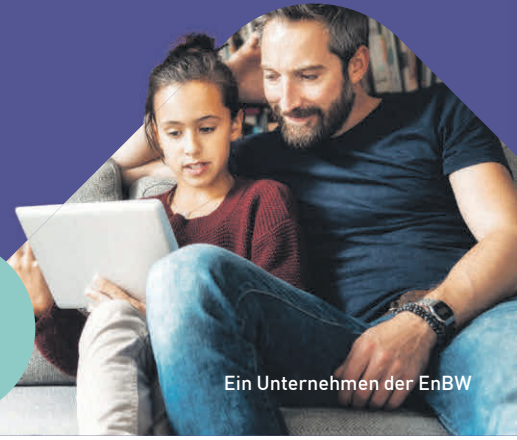
Ein Unternehmen der EnBW

Bereits Kunde? Einfach im Kundenportal upgraden!