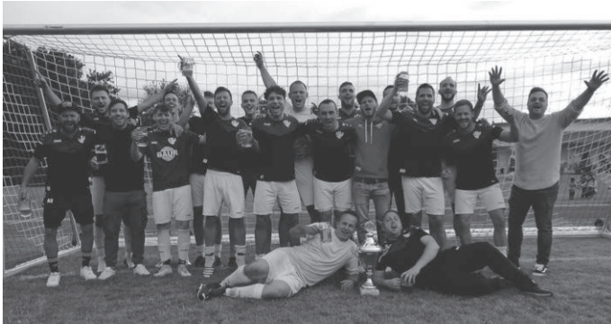
Die Siegermannschaft mit dem Iller-Weihungstalpokal

Freude über den „Pott“ war grenzenlos. Schließlich handelte es sich um den ersten Titel der noch jungen Vereinsgeschichte der SG Sießen/Wain.