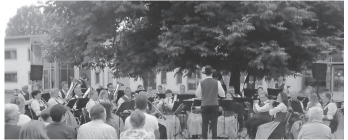
Serenadenkonzert am 23.07.2023

se, wobei er sich immer wieder Anleihen des humoristischen Dichters "Wilhelm Busch" bediente, das Publikum animierte und für den einen oder anderen Lacher sorgte.