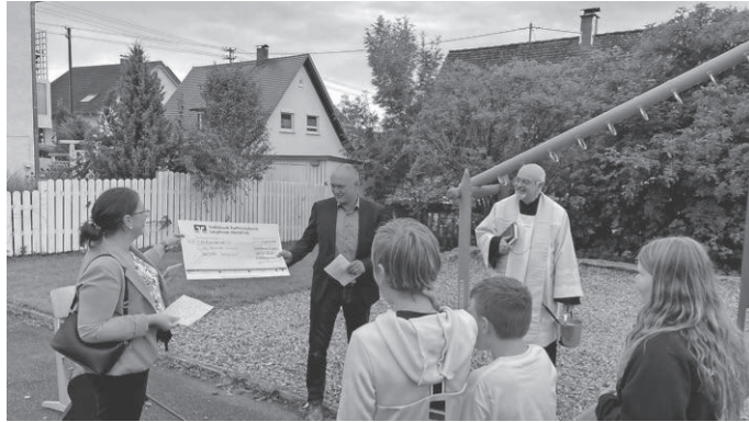
Das Team der Grundschule Orsenhausen-Sießen