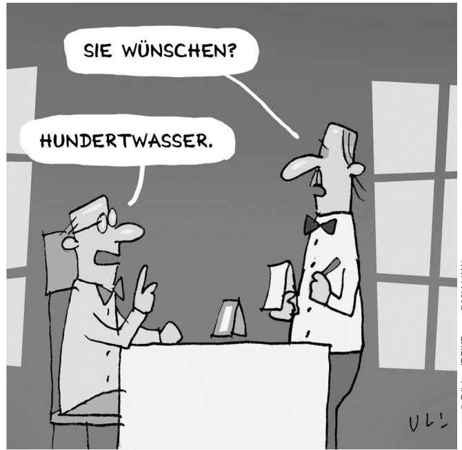
HAMSTERN IN DER KULTURGASTRONOMIE