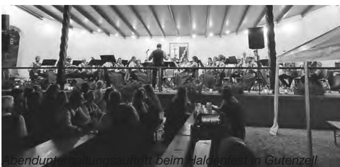
Abendunterhaltungsauftritt beim Haldenfest in Gutenzell

Am vergangenen Samstag durften wir, zusammen mit dem Musikverein Balzheim, für die Abendunterhaltung am Haldenfest in Gutenzell sorgen. Der Musikverein Balzheim legte vor, bevor der Musikverein Schönebürg gegen 21:30 Uhr übernahm. Dank einer lauen Sommernacht und einem abwechslungsreichen zusammengestellten Programm durch unseren Dirigenten, blieb der Festplatz auch bis zur später Stunde gut gefüllt.