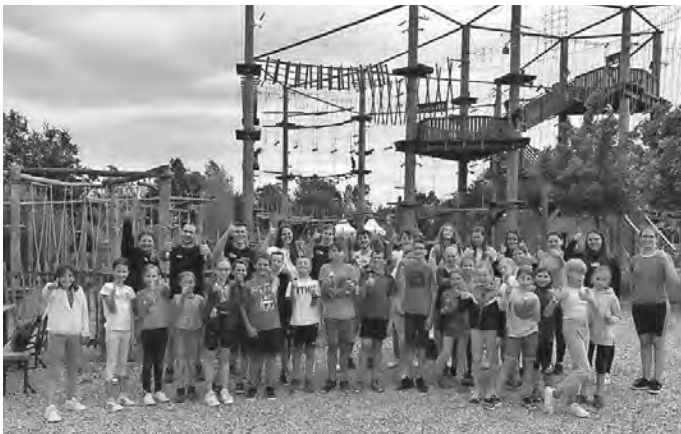
Die Jungmusiker des Musikverein Schönebürg beim Klettern im MobiPark in Laupheim.

Nach einer kurzen Einweisung konnten alle Kinder in den Parcours mit unterschiedlichen Schwierigkeitsstufen klettern. Besonders gut kamen hier die Seilbahnen des Kletterparks an. Gemeinsam machten wir in Laupheim eine kleine Erholungspause, sodass wir uns dann wieder auf den Heimweg nach Schönebürg machen konnten, wo uns auch schon das Abendessen erwartete. Den Abend ließen wir mit Spielen drinnen und draußen sowie einem Stockbrot am Lagerfeuer ausklingen. Nach dem Frühstück endete der Jahresausflug der Jungmusiker.