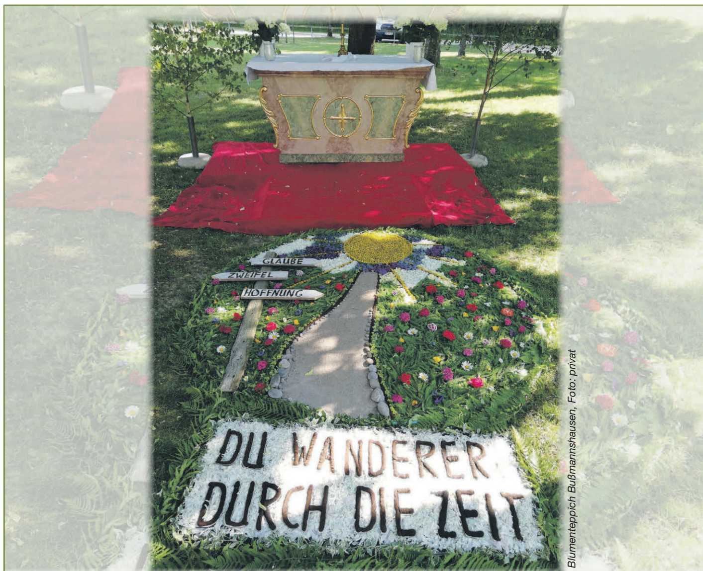
Blumenteppich Bußmannshausen, Foto: privat

Auch in diesem Jahr konnten wir an Fronleichnam wieder die schönen Blumenteppiche in unseren Ortschaften bestaunen. Sie wurden mit liebevoller Hingabe und mühevoller Kleinarbeit von unseren Ehrenamtlichen in den Kirchengemeinden gestaltet.