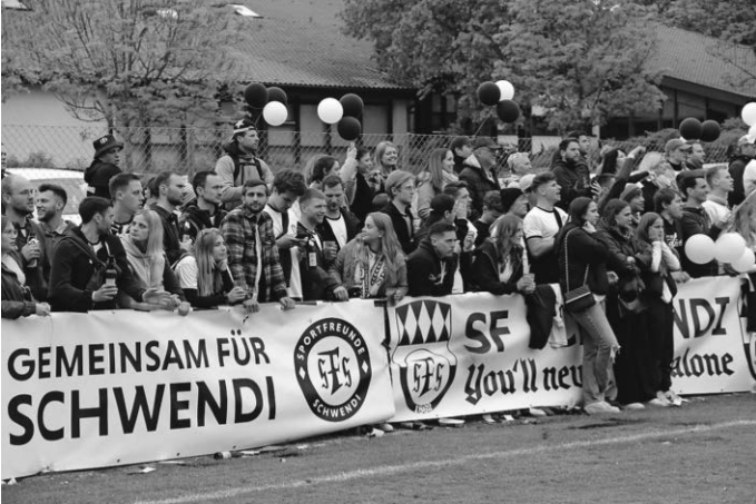
Die I. Mannschaft und auch die A-Jugend wurden bei den Finalspielen in Burgrieden lautstark von zahlreichen Fans unterstützt.

Herzlichen Glückwunsch an unsere A-Jugend-Spieler, den Trainern und der Jugendleitung für diesen großartigen Erfolg.