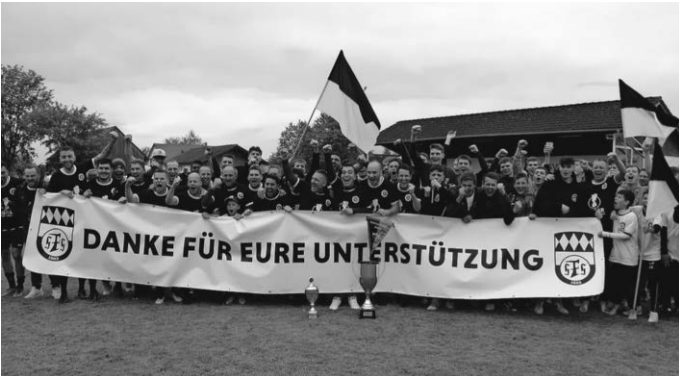
Nach dem Schlusspfiff feierten beide Mannschaften den Doppel-Pokalsieg und bedankten sich bei den Zuschauern für die großartige Unterstützung.