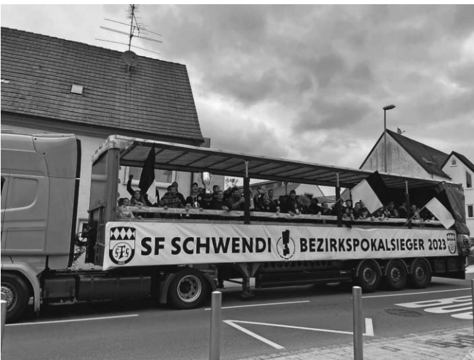
Beim Siegeszug durch die Straßen von Schwendi feierten Spieler, Fans und Verantwortliche gemeinsam auf einem LKW-Auflieger.