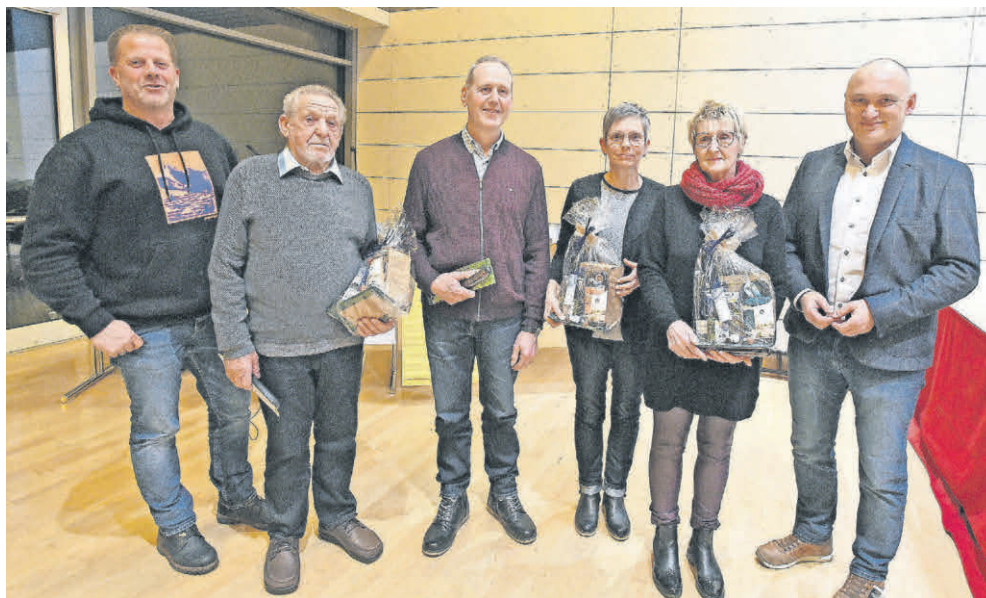
Die Preisträger mit der höchsten Auszeichnung.

Im Anschluss lud die Gemeinde die Teilnehmer und Besucher noch zu einem zwanglosen Umtrunk, bei dem alle Gartenbegeisterten ihre Erfahrungen austauschen konnten, ein.