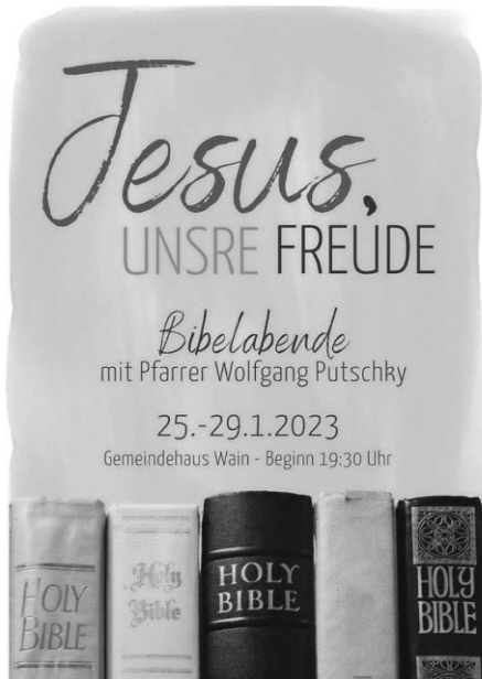
Ev. Kirchengemeinde Wain

Die weiteren Gruppen und Kreise treffen sich zu den bekannten Zeiten.