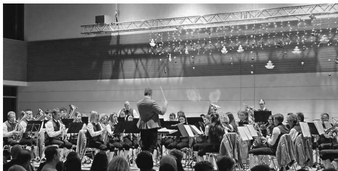
Der MV Bußmannshausen mit Dirigent Joseph Hayd

Zum Abschluss wurde der Musikverein beim „Süßer die Glocken nie klingen“ durch den Gesang aus dem Publikum unterstützt.