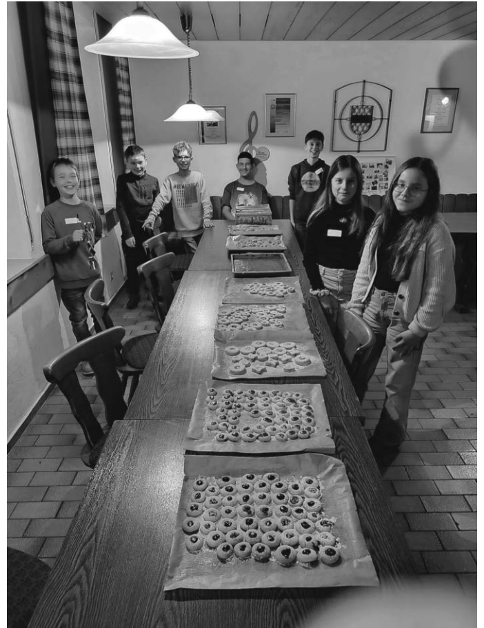
Jugendabend: "Brädla backen"