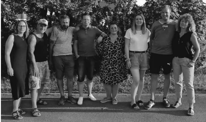
Zunft der NZ Schwendi e.V.