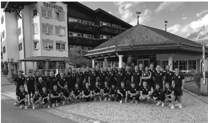
Das Bild zeigt die Teilnehmer der Fahrt nach Lermoos.

Auch in diesem Jahr bereiteten sich die aktiven Mannschaften im Trainingslager im österreichischen Lermoos auf die neue Spielzeit vor. Disziplinierte und kraftintensive Trainingseinheiten, tägliches Aquajogging, Saunagänge und Läufe vor der malerischen Kulisse der Zugspitze sorgten bei den Fußballern für Motivation, Teamgeist und körperliche Fitness.