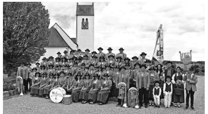
Auf Euer Kommen freut sich der Musikverein Schönebürg e.V.

Informationen zu Veranstaltungen, zur Ausbildung oder zu sonstigen Aktivitäten des Musikvereins findet Ihr wöchentlich im Amtsblatt der Gemeinde Schwendi sowie auf unserer Homepage www.mv-schoenebuerg.de oder auf unserer Facebook oder Instagram Seite.