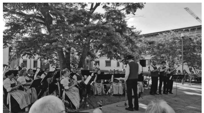
(Serenadenkonzert am 12.06.2022)