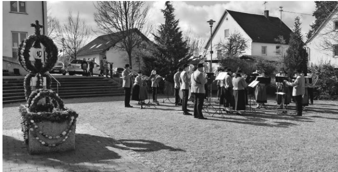
Frühlingsständchen auf dem Dorfplatz