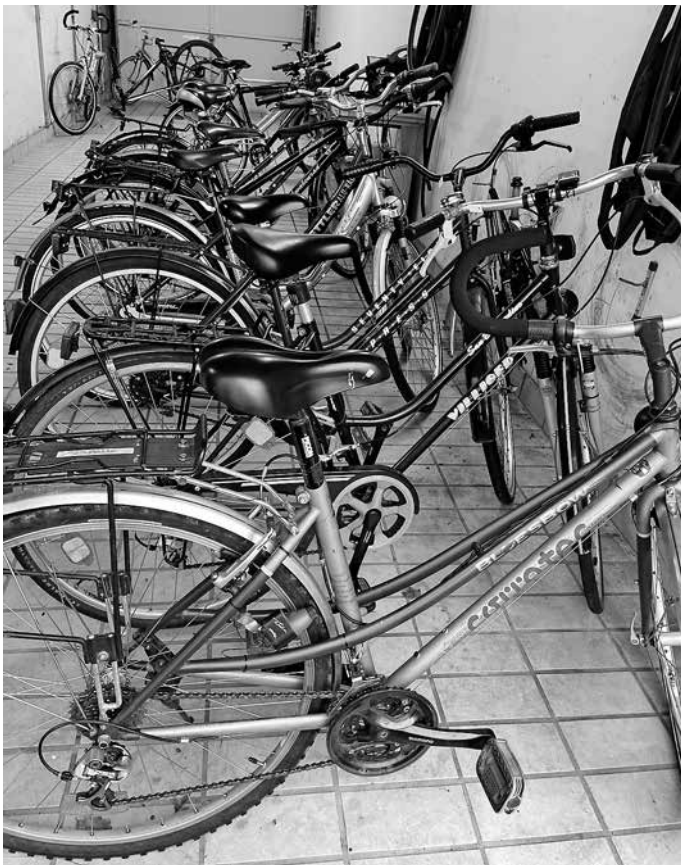
Einige Fahrräder sind bereits repariert.

Interessierte Geflüchtete dürfen dort auch unter Anleitung Fahrräder reparieren. Wer an einer ehrenamtlichen Mitarbeit Interesse hat, darf gerne vorbeischauen. Die Werkstatt befindet sich im Hof oberhalb des früheren Mitarbeiterparkplatzes. Geplant ist, die Werkstatt künftig zweimal pro Woche zu öffnen. Vielen Dank an alle, die bei diesem Kulturen-Café mitgeholfen haben: dem Organisationsteam, allen, die etwas mitgebracht haben, dem Team der Fahrrad-Werkstatt, den Integrationsmanagerinnen, den Hausmeistern, der Security, der Musik und allen Besuchern fürs Kommen.