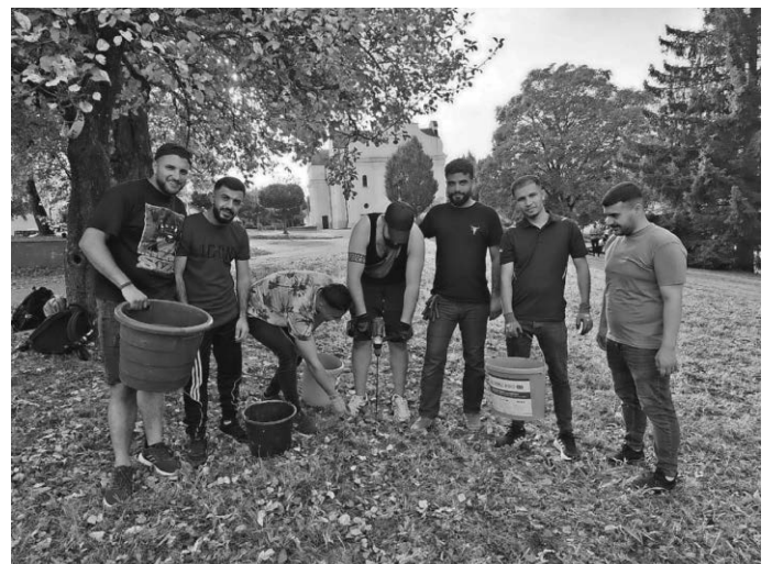
Eine große Unterstützung waren die Asylbewerber beim Vergraben der Blumenzwiebel.

Einen detaillierten Bericht zu dieser Aktion finden Sie unter „Blühendes Schwendi“.