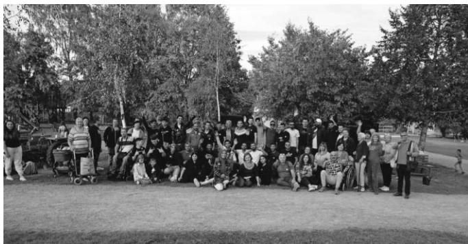
Ein gelungener Nachmittag in Kürnbach (Bild: E. Koprivc).

Am 6. Oktober hatten viele geflüchtete, ukrainische Familien sowie türkische und syrische Asylbewerber die Gelegenheit, einen Ausflug ins Oberschwäbische Museumsdorf Kürnbach zu unternehmen und eine Abwechslung im Alltag zu erfahren. In Begleitung von Integrationsmanagerinnen des Landratsamtes, der Beauftragten der Diakonie Biberach und einem Team vom Helferkreis Asyl konnten die Geflüchteten bei Führungen Einblicke in das frühere bäuerliche Leben in Oberschwaben gewinnen.