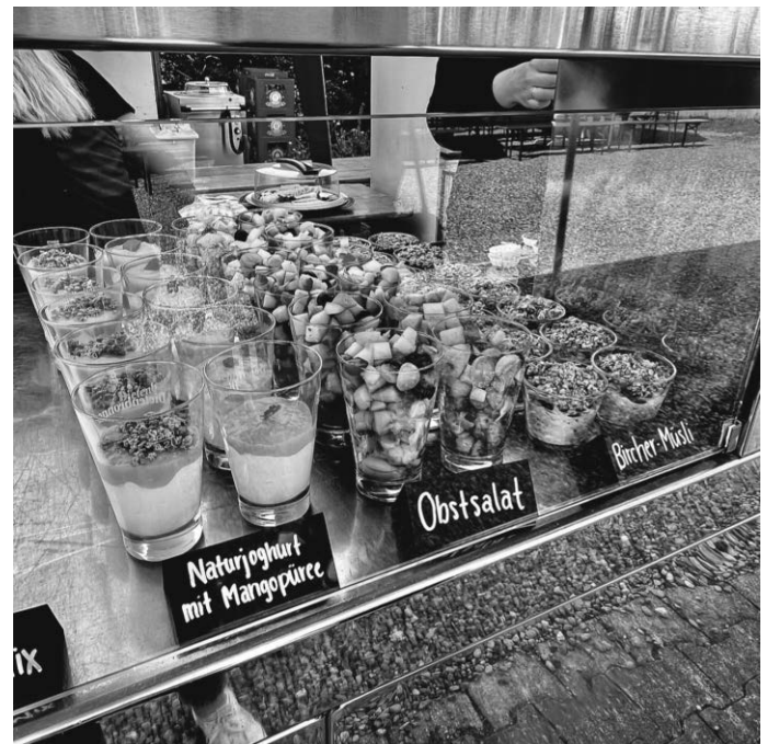
Selbstgemachter Obstsalat und Bircher-Müsli wurden am Buffet angeboten.

Der Wirtschaftsausschuss des Musikvereins hat sich nicht lumpen lassen und hat einen vielseitigen Brunch auf die Beine gestellt. Es wurden allerlei Köstlichkeiten angeboten. Von Käsespießen über Frischkäse-Dip mit Gemüserohkost sowie einer großartigen Auswahl an Aufstrichen für das vielseitige Backwarenangebot. Warme Waffeln und Rührei in verschiedenen Varianten wurden ebenfalls angeboten und im sogenannten „Live Cooking“ vor den Augen der Gäste zubereitet. Wer es jedoch etwas herzhafter bevorzugte, konnte zwischen Weißwürsten oder einer Flädlesuppe wählen. Bei diesem reichhaltigen Buffet, war wirklich für jeden Geschmack etwas dabei.