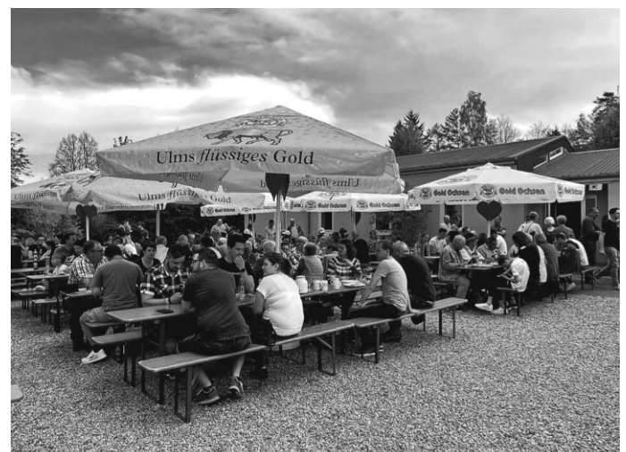
Das angenehme Ambiente im Innenhof des Musikerheims, lud die Besucher zu einem gemütlichen Beisammensein ein.

Um 11:00 Uhr ging es nahtlos zum Mittagessen über. Das Mittagessen, wurde wie immer, bestens von den Besuchern angenommen. Unterhalten wurden die Besucher von dem Vorstufenorchester sowie von der Gemeinschaftsjugendkapelle Schönebürg-Mietingen. Für unsere kleinen Besucher war ebenfalls einiges geboten. Egal ob Kinderschminken, Riesenseifenblasen oder eine Fahrt mit dem Zügle – die Kinder waren mehr als begeistert.