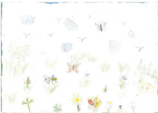
2. Platz: Katja Beck, 8 Jahre, aus Schwendi