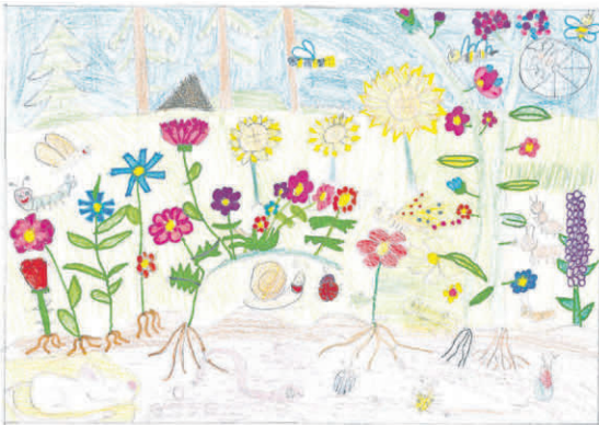
1. Platz: Adhya Shayvya Jogi, 8 Jahre, aus Schwendi