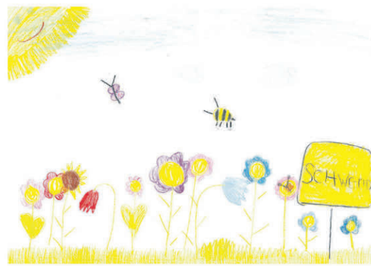
3. Platz: Nora Faßnacht, 6 Jahre, aus Schwendi