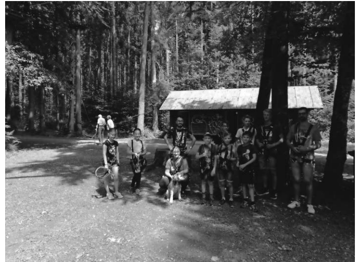
Jungmusikerausflug in den Burrenwald

Euer Team Jugend des Musikverein ROTA Schwendi!