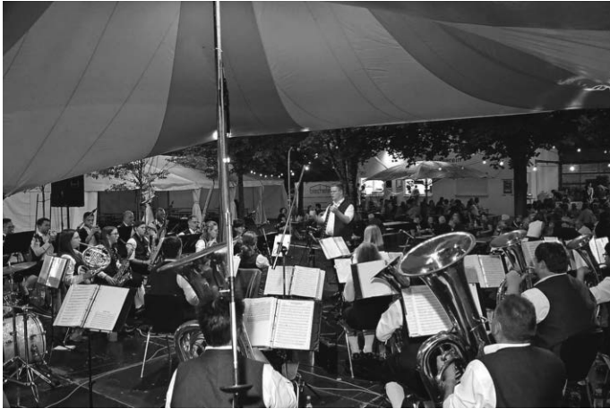
Der MV Bußmannshausen beim Gartenfest in Bußmannshausen